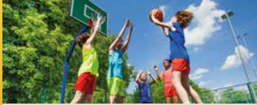
Noodfonds voor verenigingen (p.2)