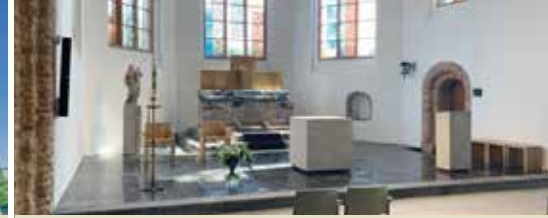
Herbestemming kerk succesverhaal (p.3)