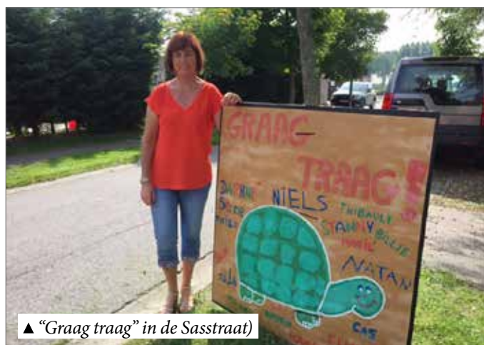
▲ "Graag traag" in de Sasstraat

Om Ramskapelle leefbaar te houden, denken wij aan verkeersremmers zoals paaltjes om de snelheid te beperken. Het kan ook eleganter met verdrijvingsvlakken of wegversmallingen. Zo kunnen we via de infrastructuur een gematigde snelheid afdwingen. Aanvullend kan de straat ook ingedeeld worden als zone 30 met officiële 'graag traag' borden.