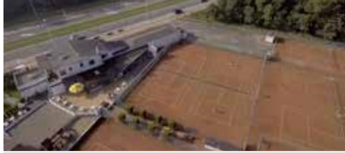
Chalet Suisse open voor particuliere kopers blz. 2