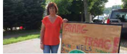
Verkeersveilige Sasstraat blz. 3