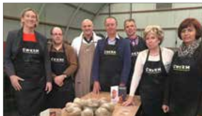
▲ De bestuursleden en mandatarissen van N-VA Knokke-Heist herdachten de slachtoffers van Wereldoorlog I met herdenkingsbeeldjes voor project CWXRM.