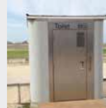
Hoge nood aan openbare toiletten p. 3