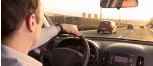
West-Vlaanderen moet inzetten op autodelen p. 2